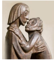
Ernst Barlach, Das Wiedersehen

Und Jesus sagt zu ihm: „Weil du mich gesehen hast, Thomas, darum glaubst du. Selig sind, die nicht sehen und doch glauben! Ich bin da, auch wenn du mich nicht siehst.“